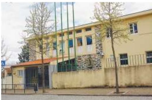
ESCOLA BÁSICA E SECUNDÁRIA DE MOGADOURO Rua Luís de Camões n°5 5200 – 279 Mogadouro telefone – 279341369