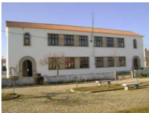
ESCOLA BÁSICA DE BEMPOSTA Largo Santo Cristo 5200- 029 Mogadouro telefone: 279107784