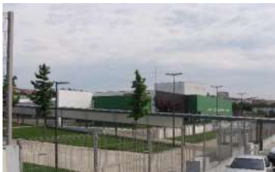
ESCOLA BÁSICA DE MOGADOURO Quinta da Aagueira 5200-202 Mogadouro telefone: 279107782